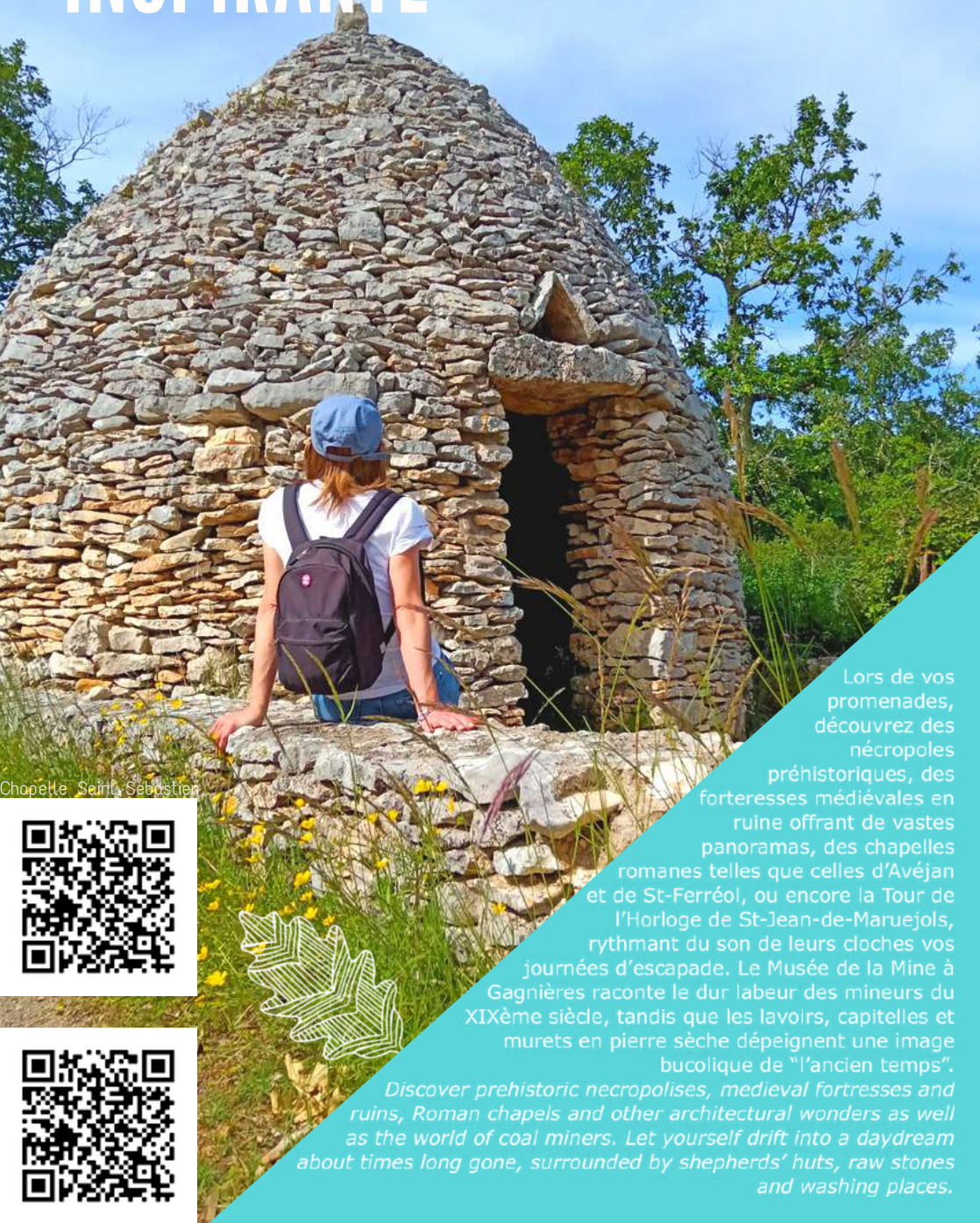
Chapelle Saint Sébastien